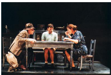
Conversation en Wallonie (2001) mise en scène : Armand Delcampe