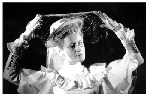
Simenon (1994) mise en scène : Armand Delcampe